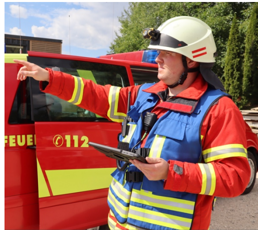
Abbildung 1: Zugführer im Einsatz - unterstützt mit aktuellen Lagedaten am Tablet

Kleine Feuerwehren können die App „All-in-One“ für Ihre Einsatzführung und Verwaltung verwenden, da sie sich auf die maßgeblichen Anforderungen fokussiert und somit intuitiv und übersichtlich ist. Für größere Feuerwehren mit bestehender Software-Infrastruktur passt sich die App modular und vernetzt ein, um die spezifischen Herausforderungen zu lösen. Geschäftsführer Pascal Steinmüller betont: „Durch unsere eigene Einsatz-Erfahrung wissen wir, was ehrenamtliche Helfer leisten. Mit unserer App können wir das Engagement zukunftsfähig machen“.